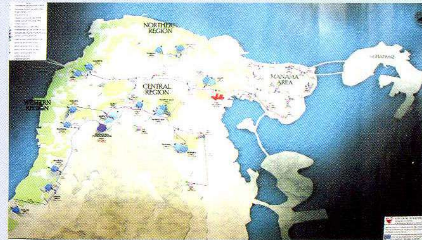
خارطة توضح خطوط نقل المياه المعالجة من المحطة إلى الخزانات

■ تم البدء فعلياً في تنفيذ الجزء الأول من المشروع، والخاص بأعمال التوسعة في وحدات المعالجة الثانوية في محطة المعالجة، والذي يشمل أحواض الترسيب والتهوية.