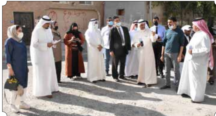
جانب من زيارة لجنة الخدمات مع ممثلي وزارة الأشغال لمنطقة المصلى

الطلبات التي يقترحها المجلس أو التي ينقلها الأهالي، مشيراً إلى أن هذا التعاون يسهم في تحقيق المزيد من تطلعات الأهالي وتلبية احتياجاتهم. وأكد على استمرار منهجية لجنة الخدمات والمرافق العامة في تنظيم الزيارات الميدانية لمختلف مناطق العاصمة؛ لتكون قريبة من المواطنين واحتياجاتهم، موضحاً بأن نجاح هذه المنهجية جاء بفضل جهود وتعاون أعضاء اللجنة وتكاتفهم في سبيل تقديم أفضل ما يمكن لهم.