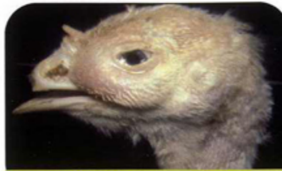
انتفاخ الوجه من علامات المرض

• أعراض عصبية كالتهيج والارتجاجات والهزع ، والسير في شكل دائرة