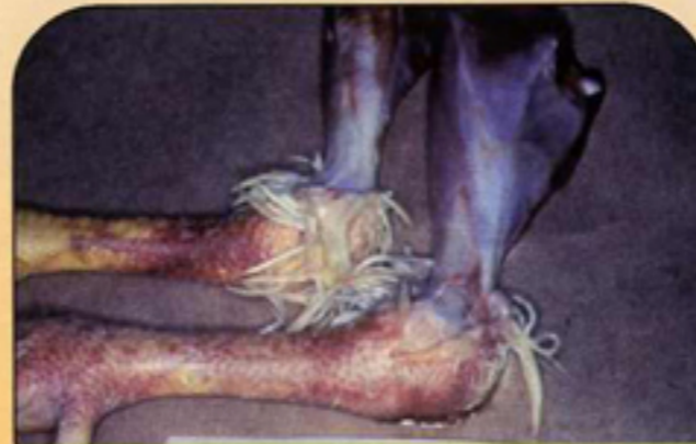
التهاب شديد في العضلات ونزيف تحت الجلد