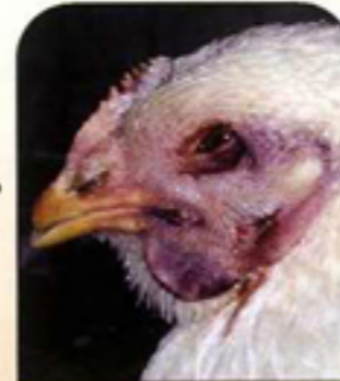
التهاب شديد في العرف والدلايات وغولها إلى اللون الأزرق